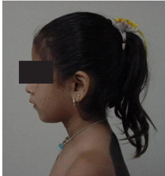
Fig. 2. Micrognatia, pabellones auriculares con implantación baja, puente nasal alto, lentigos múltiples en región facial muy pequeños.