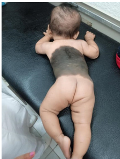
Fig. 5. Nevo melanocítico gigante en tórax posterior, y un nevo de menor tamaño localizado en cara interna del muslo derecho.

Los estudios de biometría hemática, química sanguínea y examen general de orina fueron normales. El resultado del tamiz metabólico neonatal con toma de la muestra a los seis días de nacido fue 7.20 unidades por decilitro; una prueba confirmatoria fue realizada 13 días más tarde, con resultado de 6.70 unidades por decilitro. El estudio de piel de la región afectada en la espalda, obtenida por biopsia, con técnica de punch 5mm, reportó “nevo melanocítico intradérmico pigmentado”. Límites quirúrgicos positivos para lesión neoplásica. Negativo para células displásicas”.