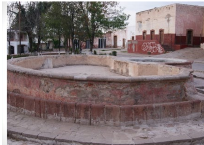
Imagen 2: La Pila

Es importante señalar que actualmente ya queda poco rastro material, debido al crecimiento poblacional. Se puede inferir que el sistema hidráulico que se presenta es una de las obras más sobresalientes que se pueden observar, pues la afluencia del material líquido pudo haber sido el detonante del crecimiento y desarrollo que presentó la hacienda.