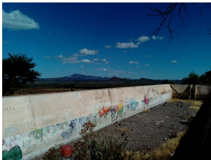
Imagen 3: El Dínamo

Uno de los canales conduce hacia la una pila que se encuentra en la parte central del casco de la ex hacienda (imagen 2). Enseguida con la misma dirección rodea el cerro "El Socavón" y desemboca en lo que se conoce como la "La Pila del Dinamo", aquí es donde se realiza el proceso de transformación del agua mediante dinamos, aunque este proceso no es posible describirlo ya que se pierde el vestigio constructivo (imagen 3).