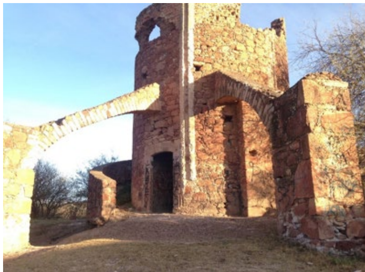
Imagen 1: La Alameda