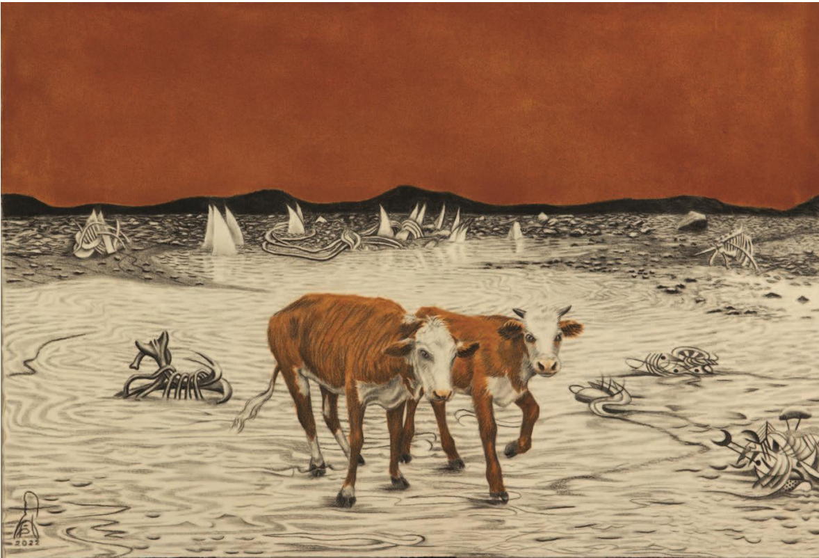
Autor: Juan Carlos Villegas. Título: EN EL ARCHÉ ERAN LAS VACAS / Carbón y tierra zacatecana (óxido de hierro) / papel algodón / 38 x 56