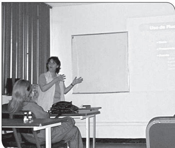
Impartiendo conferencia en la Facultad de Odontología de la Universidad del Zulia, Venezuela.