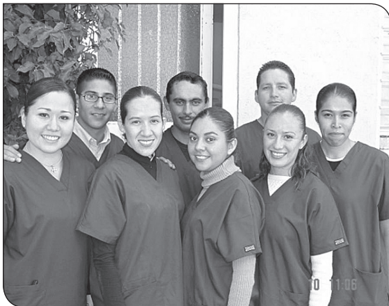
Alumnos de la VIII generación de la Especialidad en Odontopediatría de la UAO/UAZ.