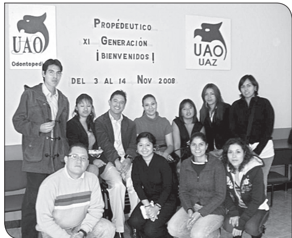
Alumnos aspirantes a la XI generación de la Especialidad en Odontopediatría de la UAO/UAZ.