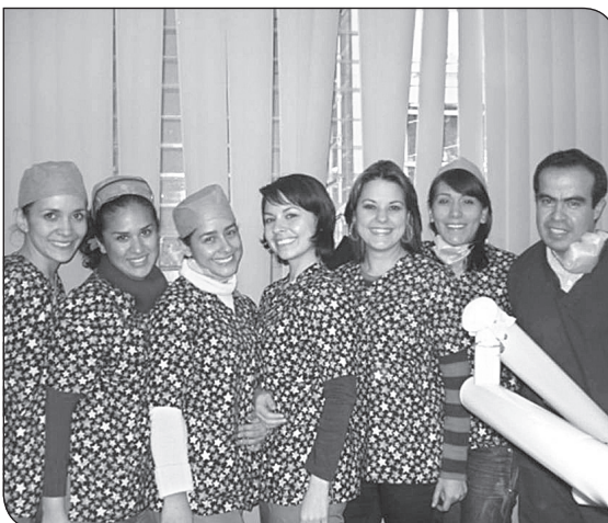
Alumnos de la X generación de la Especialidad en Odontopediatría de la UAO/UAZ.