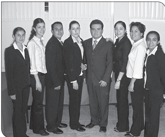
Alumnos de la IX generación de la Especialidad en Odontopediatría de la UAO/UAZ.