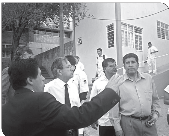
Personal del Consejo Nacional de Educación Odontológica, A. C., evaluando instalaciones y los PE (Especialidad en Odontopediatría) de la UAO/UAZ, para dictaminar su acreditación.