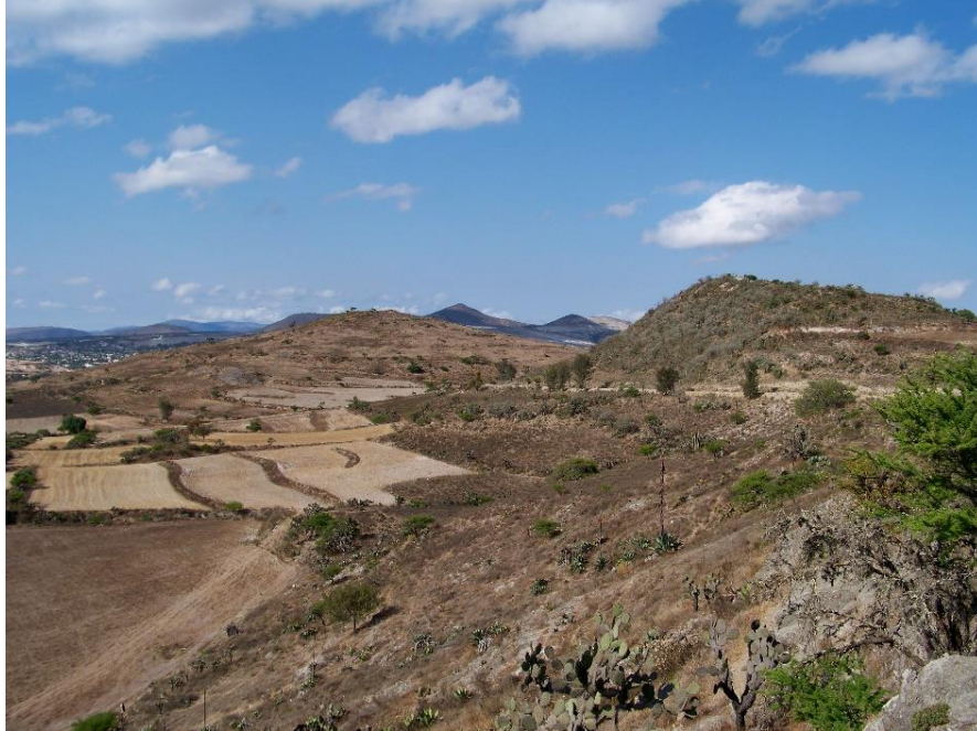
Figura. Cerro Naduza (izquierda) y cerro Ñiaxugue (derecha).

Naduza-Ñiaxugue comienza a establecerse en la fase Cruz Tardío (700 - 300 a.C.). Primeramente el patrón de asentamiento muestra una preferencia por los lugares en el pie de monte, laderas y en las partes altas de los cerros. La ubicación del asentamiento humano en estas áreas es notable en otros sitios de la misma temporalidad (Spores, 1972) como Yucuita (Plunket, 1983: 341-355) y Tayata (Balkansky et al. 2004; Kowalewski et al., 2009:174-178). Pero en general, Naduza-Ñiaxugue funcionó como un pequeño centro, con una extensión total del sitio de 120 ha. y una población media de 9.000 habitantes en el área (García Ayala, 2011:65) (tabla 1).