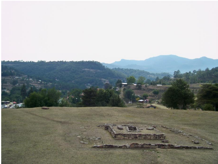
Figura 4. Arquitectura monumental de Huamelulpan.

Junto con los pequeños asentamientos circundantes, Huamelulpan midió 205 ha. y se calcula una población total entre 8,000 y 17,000 personas (Kowalewski et al. 2009:166-167) (tabla 3). Las excavaciones de Gaxiola (1976:210) denotan especialización, diferencia de funciones (religiosas, políticas, económicas) y clases de alto y bajo estatus.