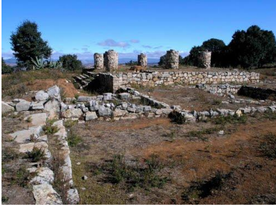
Figura 6. Arquitectura de Monte Negro.