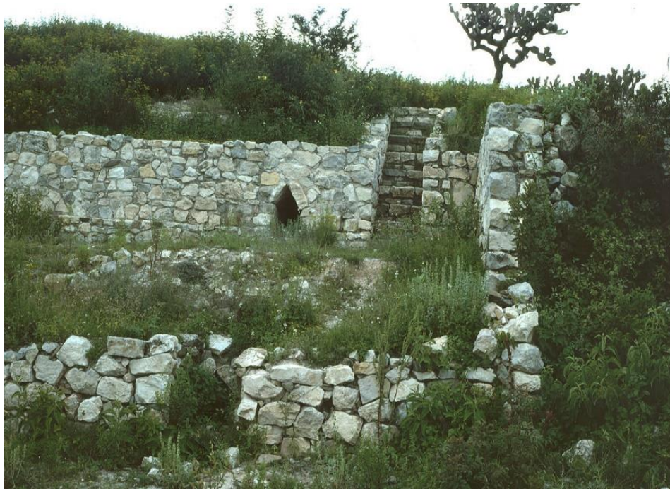
Figura 5. Arquitectura de Yucuita. (Fotografía tomada de inafed.gob.mx).