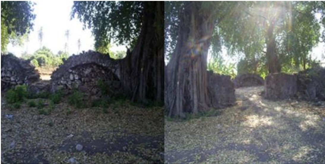
Fotografía 7: Restos de iglesia colonial en Pinzandaro, 2007

La población de Pinzandaro es una región que se encuentra dentro del municipio de Buena Vista, ésta lleva como evidencia de sus transformaciones las estructuras de una vieja iglesia que esta registrada como construida en 1585 (Fotografía 7). La estructura es de una sola nave y al parecer los arcos son parte del cimiento, la altura es considerable, es probable que debajo de la misma pasara el Río.