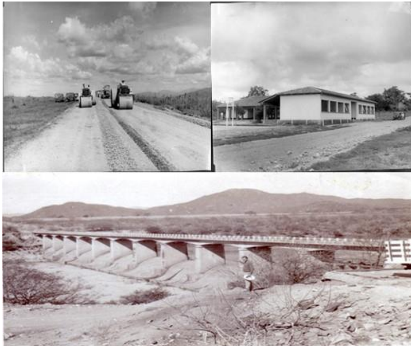
Fotografía 2: Obras de mejora urbana en la región de Tierra caliente a través de la implementación del reparto agrario

esta área de Michoacán, tal es el caso de carreteras, escuelas, instalaciones de luz y agua potable, entre otras cosas (Fotografía 2) (Escamilla: 2; Espín, 1986: 239). Esto refleja claramente que las acciones sociales generan transformaciones de orden ecológico que quedan registradas en la historia, en el paisaje y en la población.