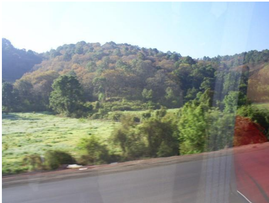
Fotografía 1: Bosque de pino y encino en Tierra caliente, 2007

Una de las acciones más comúnmente llevadas a cabo en la región es la tala del bosque de pino y encino, sobre todo en época porfiriana, pues es entonces que empiezan a ampliarse las vías de comunicación del ferrocarril (Espin, 1986: 240). Esta acción genera trabajo para diversos grupos locales, pero también trastorna el microclima local, haciendo que las pérdidas sean irreparables (Fotografía 1).