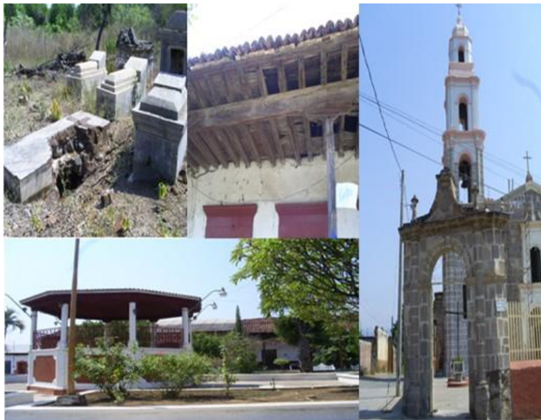
Fotografía 4: Arriba a la izquierda el cementerio y el resto pueblo viejo, 2007

En la región de Buena Vista pueden apreciarse diversas cadenas montañosas, lo que podría haber sido utilizado como beneficio para siembra, los pueblos antiguos aprovechaban los escurrimientos de agua para el crecimiento de sus cultivos.