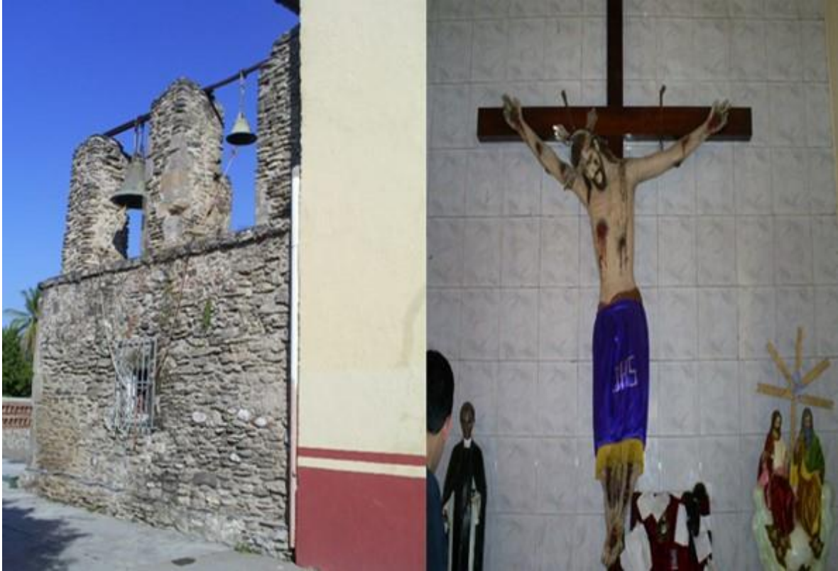
Fotografía 8: Iglesia de Santa Ana Amatlán y Cristo de pasta de caña que se encuentra en el interior de la capilla, 2007

En toda la región de Tierra caliente pueden apreciarse elementos relacionados con los cambios de las costumbres, tanto productivas como sociales y culturales, prueba de ello es el cambio arquitectónico que se ha dado en la zona, en estos rasgos puede resaltar la presencia de emigrantes y narcotraficantes que realzan su poder a través de construcciones llamativas y coloridas (Malkin, 2001).