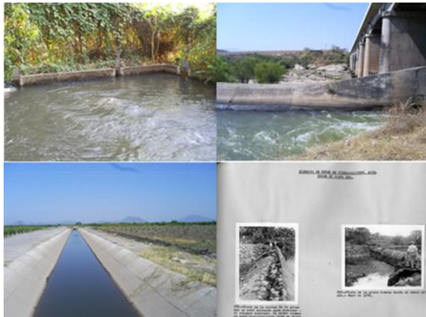
Fotografía 3: Mejoras de infraestructura para riego de sembradíos en Tierra caliente

Con la incursión de la Comisión de Tepalcatepec, en esta región se crean programas de desarrollo de infraestructura que además de mejorar las condiciones de vida, permiten que los recursos de la región sean más aprovechados, para lo cual se construyen presas, se mejoran los sistemas de riego, se implementan las semillas mejoradas, se hace uso de maquinaria, entre otras cosas (Fotografía 3).