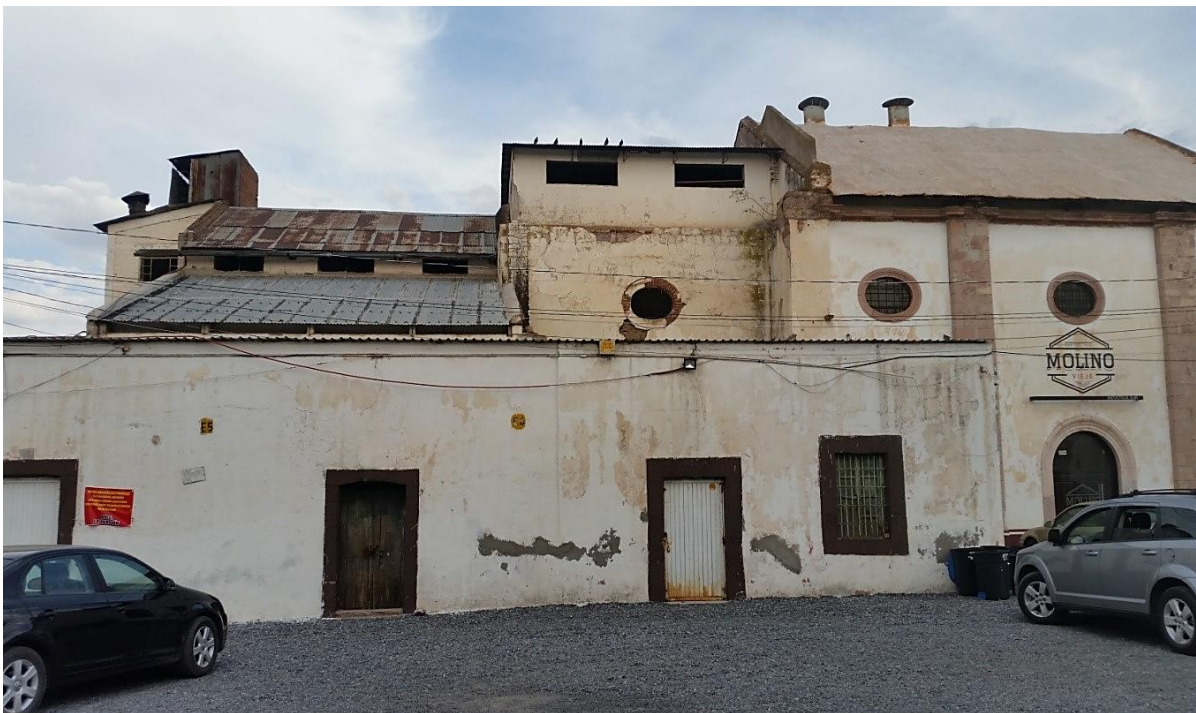
Figura 3. Fachada principal de la Harinera

Así, podemos identificar que la estructura arquitectónica del molino era básicamente de arcilla y mampostería, pues prácticamente aprovechaban los materiales del lugar. Respecto a las áreas de actividad que tenían función dentro de una harinera, Pérez (2008) describe que el interior de la estructura constaba de tres partes, en la planta baja se depositaban los costales