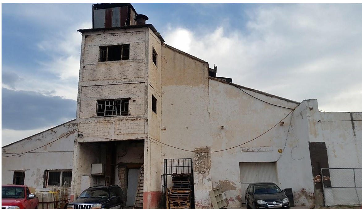
Figura 4. Ala oriente de la construcción, actualmente en desuso.

del trigo y el maíz, en este piso iniciaba la rampa que dirigía al cuerpo de la estructura que se encontraba al centro y la cual soportaba la maquinaria de molienda.