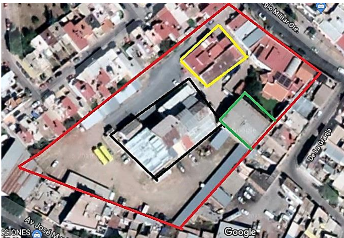
Figura 2. Imagen tomada de Google earth. (En negro, nave principal de la harinera; en verde, bodega adjunta y, en amarillo, construcción moderna).

el área delimitada se identificó un conjunto de bodegas que forman parte de una construcción moderna. (Figura 2).