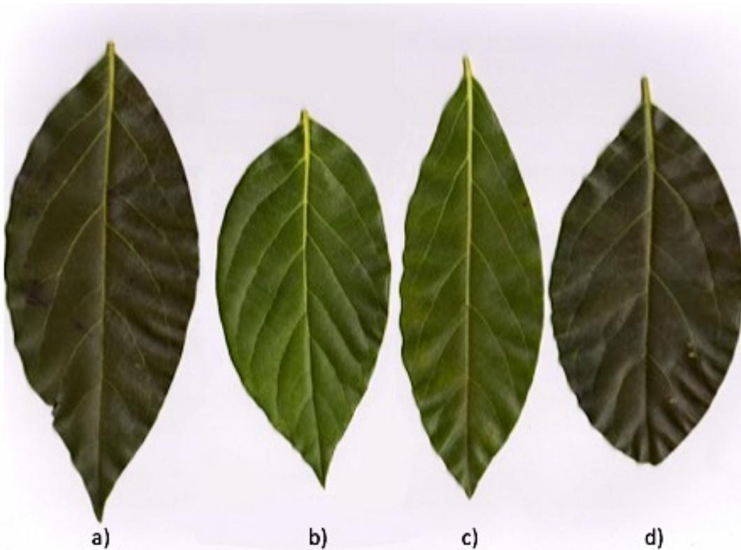
Figura 3. Variación morfológica en hojas de aguacates nativos del Estado de Nuevo León: a) hoja elíptica con ápice agudo; b) hoja lanceolada con ápice agudo; c) hoja elíptica con ápice subagudo; d) hoja ovalada con ápice obtuso.

Figure 3. Morphological variation in avocado leaves native to the State of Nuevo León: a) elliptical leaf with acute apex; b) lanceolate leaf with acute apex; c) elliptical leaf with subacute apex; d) oval leaf with obtuse apex.