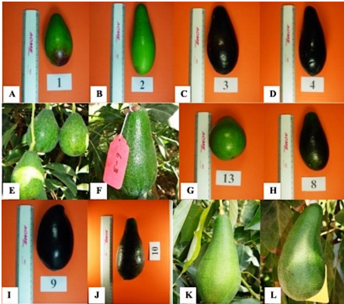
Figura 1. Materiales de aguacates criollos de Nuevo León, México. A) ‘Plátano temprano’, B) ‘Plátano grueso-1’, C) ‘María Elena’, D) ‘Campeón’, E) ‘Mantequilla’, F) ‘Calabo’, G) ‘Huevo de paloma’, H) ‘Todo el año’, I) ‘Criollo 1’, J) ‘Huevo de toro’, K) ‘Pahuita’, L) ‘Plátano Grueso-2’.