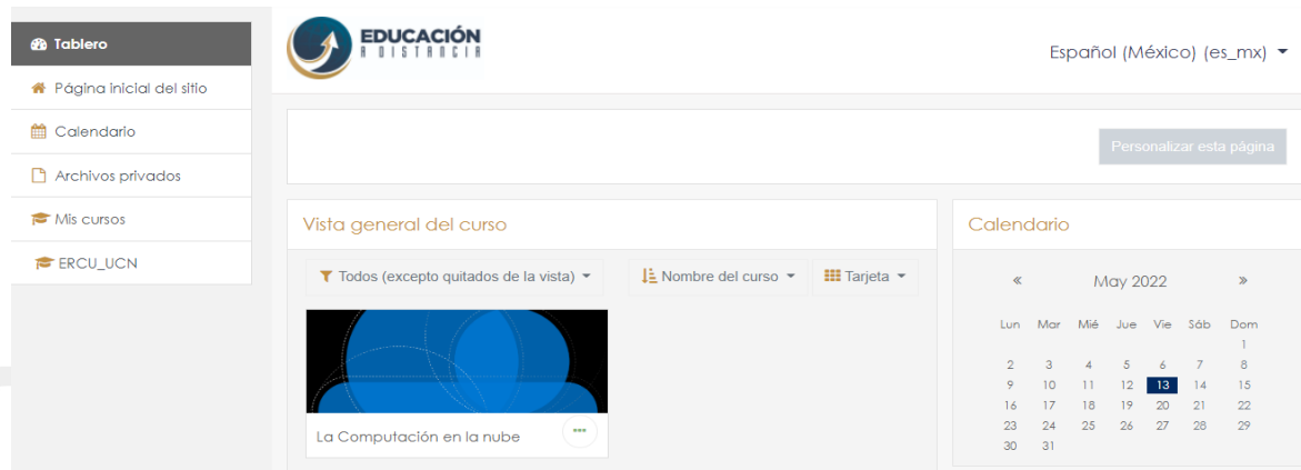
Figura 1 Carátula principal del curso en línea

En la Figura 1 se muestra la pantalla principal del producto donde ya viene registrado el curso alojado en la plataforma Moodle, además de las diferentes opciones que el usuario podrá acceder.