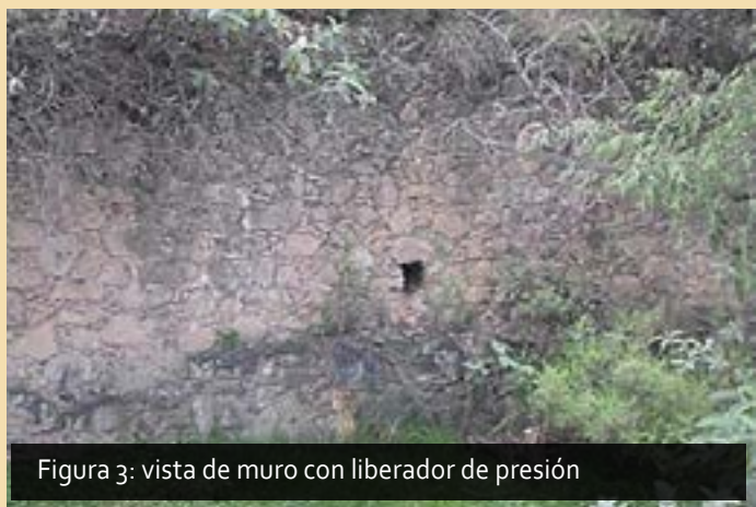
Figura 3: vista de muro con liberador de presión

Del lado este se observa un muro de piedra de mina y lajas, que se complementa con parte del cerro, ambos favorecieron la contención y dirección del agua de la presa, a lo largo de este muro se observan algunos orificios que sirvieron de liberadores de humedad, reduciendo la presión evitando con ello derrumbes (Figura 53). El muro se interrumpe por un afloramiento de roca, que complementó la función de la presa pues después de éste la obra hidráulica continúa de manera natural (Figura 3).