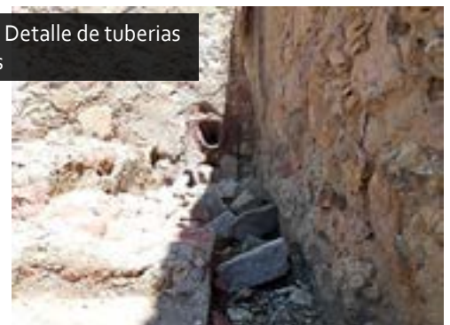
Figura 8: Detalle de tuberías interiores

Esta obra sirvió para beneficiar metales de la Hacienda, pero además favoreció el abasto de viviendas y unidades de producción de alimentos entre ellos las huertas tanto de Guadalupe como de la periferia de Zacatecas, siendo esta zona de la ciudad una de las más productivas.