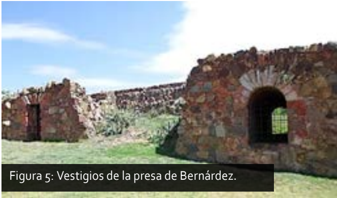
Figura 5: Vestigios de la presa de Bernárdez.

Los vestigios de esta presa se ubican en las coordenadas norte 22^{\circ} 46.145' y oeste 102^{\circ} 31.902' (Figura 5), como se mencionó en el Capítulo III su origen se remonta a 1570, funcionalmente se relacionó con el beneficio de metales, la producción agrícola, así como el abasto a las viviendas aledañas, como el Rancho de Santa Rita, y algunas zonas de Guadalupe, entre ellas las huertas de Melgar. Cabe destacar que cercana a la presa se encontraba la huerta de la hacienda beneficiada por la constante humedad.