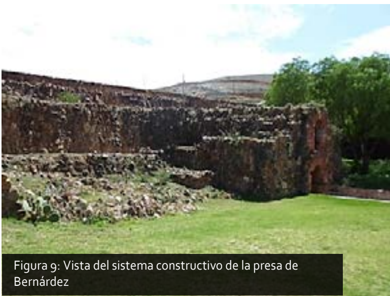
Figura 9: Vista del sistema constructivo de la presa de Bernárdez