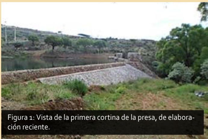
Figura 1: Vista de la primera cortina de la presa, de elaboración reciente.

Complejo hidráulico que se asocia a los terrenos, hacienda, minas y por su puesto huerta propiedad del Capitán Infante (Figura 1), la cual estuvo en función en el siglo XVIII. Esta obra fue construida a base de piedra de mina y mortero de cal, su diseño se favoreció del patrón natural del terreno para lograr más empuje en la caída del agua y cubrir mayor extensión en el abasto.