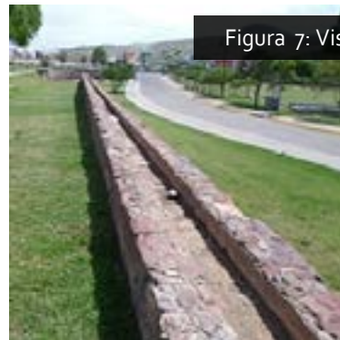
Figura 7: Vista de los canales exteriores