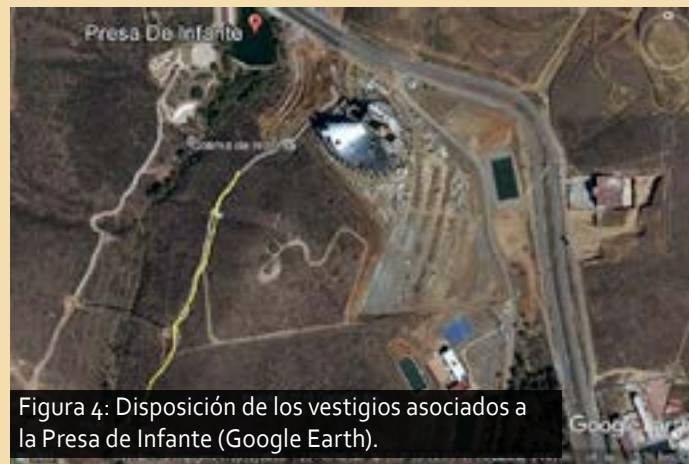
Figura 4: Disposición de los vestigios asociados a la Presa de Infante.