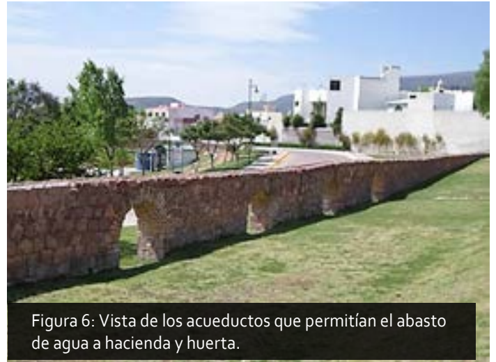
Figura 6: Vista de los acueductos que permitían el abasto de agua a hacienda y huerta.

Como parte del sistema de la presa se observa la construcción de varios niveles de muros, contra puestos los cuales servían para soportar la presión del agua y garantizar la eficacia del sistema de contención, por el tipo de construcción se puede observar que esa obra hidráulica implicó una gran inversión de tiempo, esfuerzo y por su puesto dinero (Figura 9).