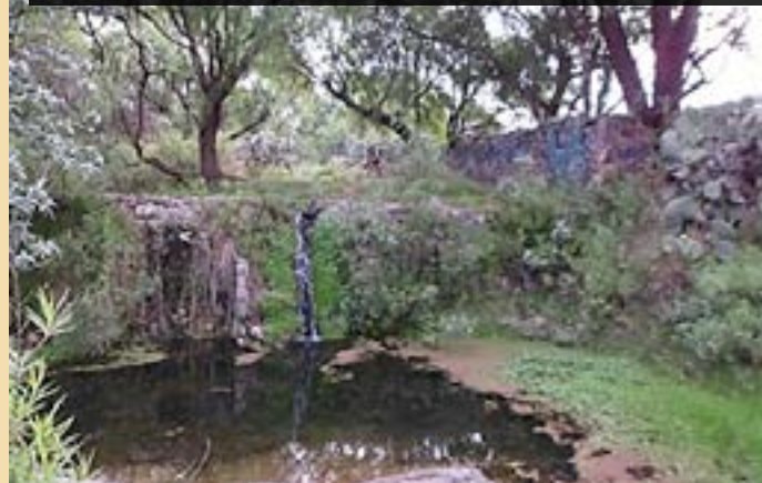
Figura 2: Cortina asociada a la contención de agua, de época remota (SXVII – XVIII).

Para el reconocimiento se tomaron las coordenadas en la parte de la cortina principal, 22^{\circ} 47.910' al norte y 102^{\circ} 33.413' al oeste, posteriormente se buscaron elementos asociados. A doscientos metros al sur se registró un primer desnivel ( 22^{\circ} 46.765' al norte y 102^{\circ} 32.651' al oeste) asociado a una pequeña cortina hecha a base de roca de mina, la cual presenta contra fuertes y un canal para desagüe, su altura visible es de 1.70 metros (Figura 2).