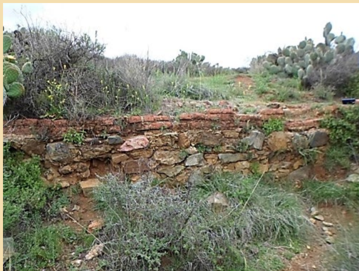
Figura 1: Muro de acequia, donde se observan dos fases constructivas.

La acequia de Bracho sufrió constantemente modificaciones, las cuales se asociaban al paso del arroyo y al nivel de corriente. Como parte de la observación del paisaje se encontraron y registraron los vestigios relacionados con esta obra, el primero fue un muro (coordenadas norte 22^{\circ}47.8081' y oeste 102^{\circ}33.436' ), con una altura aproximada de 1.23m desde el nivel de suelo. También se pueden observar dos etapas de construcción: la primera de mampostería (altura 94 cm), y posteriormente a manera de mantenimiento una de ladrillo (29 cm), cabe destacar que esta última capa se encuentra en malas condiciones a causa de la humedad, el vandalismo y alteraciones de fauna (arreo de borregos y chivas) y flora adherida al muro (musgos, helechos, pastos, intrusión de raíces) (Figura 1).