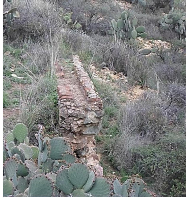
Figura 3: Detalle del canal por donde pasaba el agua.