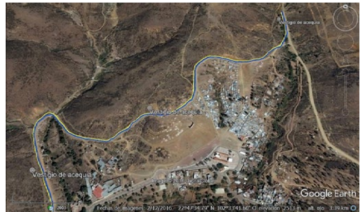
Figura 5: Disposición de la acequia en torno al paso del arroyo principal (en amarillo). La cual se infirió a partir del registro de evidencia material asociada.