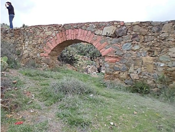
Figura 2: Vista del acueducto donde se observan las fases constructivas y un arco.

Más al norte de los primeros vestigios, a las faldas de lo que fuera la Mina de San Bernabé, se observó parte de un acueducto (Figura 2), conserva las características constructivas de las primeras fases, mampostería y adobes que delimitan el canal por donde pasaba el agua (Figura 3), el grosor de este es 28 centímetros, mientras que el espesor total del muro de la acequia es de 68 centímetros. Además, como parte de la morfología y diseño de la acequia pueden observarse dos arcos de medio punto, bien conservados, debajo de uno de éstos aun circula el agua de un arroyuelo que baja del cerro.