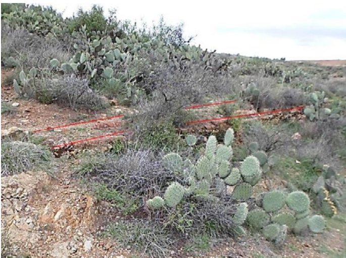
Figura 4: Vista del deterioro de la acequia.

Gran parte de la acequia está destruida, y lo que aún está visible presenta un alto nivel de deterioro (Figura 4), esto podría ser a causa de escurrimientos de agua, los cuales han dejado su marca en la acequia y en el deslave del cerro (Figura 50). Este parte de la acequia también tiene intrusión de flora (musgos principalmente).