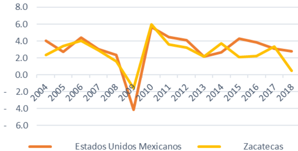
Gráfica 3. Variación porcentual anual de actividades económicas terciarias en la ciudad de Zacatecas vs la media nacional