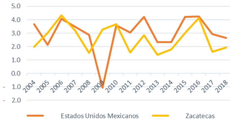
Gráfica 4. Variación porcentual anual de actividades económicas terciarias exceptuando el comercio